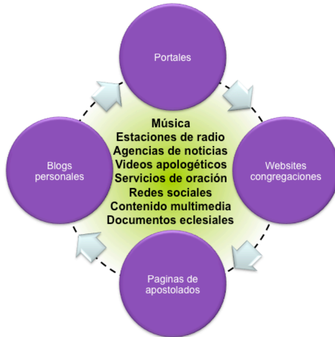
Ilustración 2 Principales herramientas de Evangelización